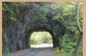
現在の大原洞門の一つ